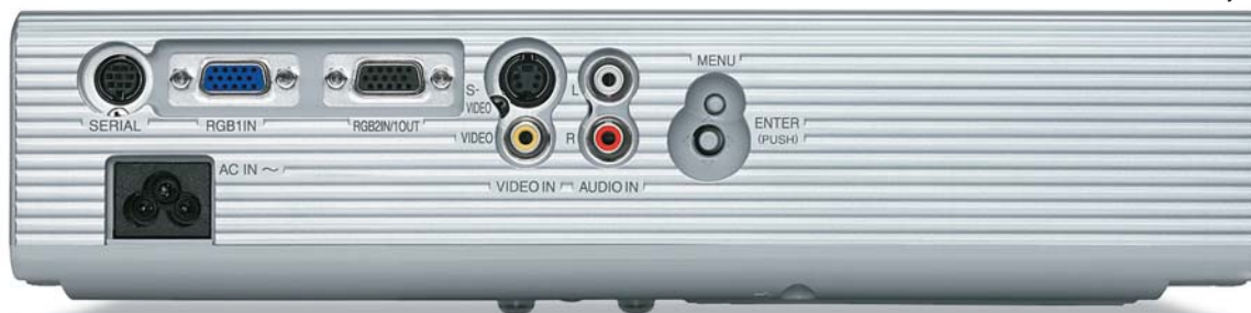
Widok z tyłu