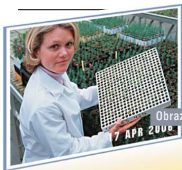
Obraz z komputera