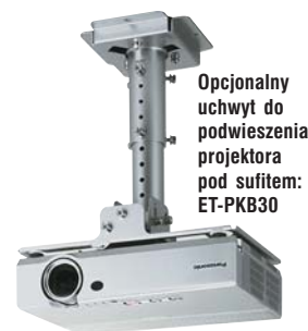
Opcjonalny uchwyt do podwieszenia projektora pod sufitem: ET-PKB30